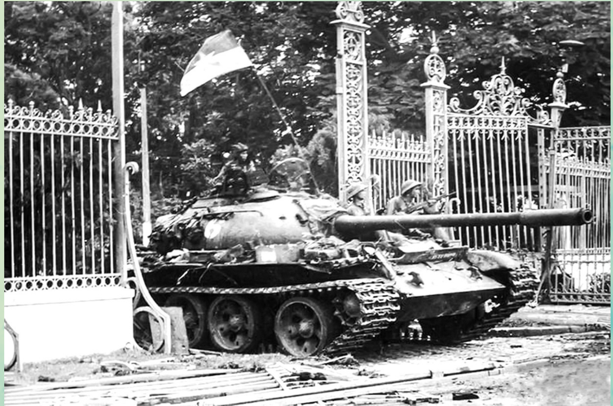
Xe tăng tiến vào Dinh Độc Lập ngày 30/4/1975

Dưới sự lãnh đạo của Đảng, quân và dân ta đã tiến hành cuộc Tổng tiến công và nổi dậy trên toàn miền Nam và liên tiếp giành thắng lợi. Cuối tháng 4/1975, quân ta ào ào như vũ bão, tiến vào giải phóng Sài Gòn. Chiến dịch Hồ Chí Minh lịch sử đi đến thắng lợi cuối cùng, non sông Việt Nam thu về một mối.