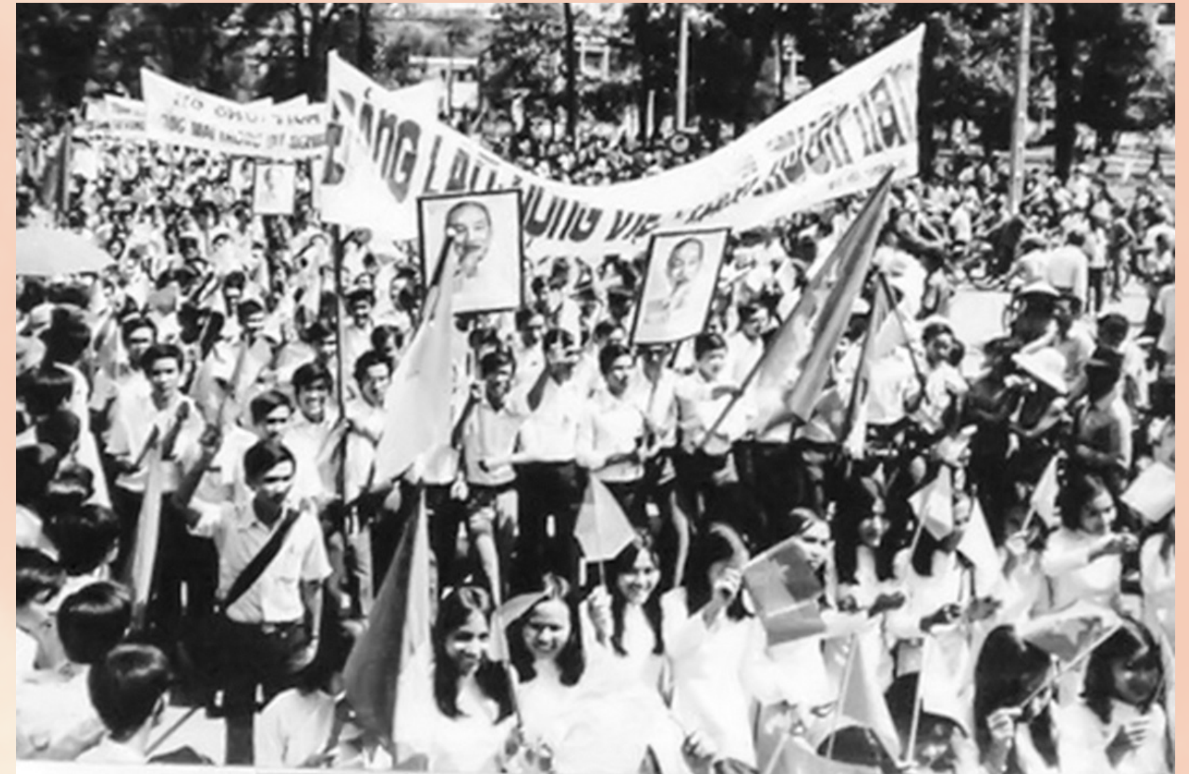
Sài Gòn rợp cờ hoa, biểu ngữ mừng chiến thắng

Ngày 30/4/1975, đại thắng mùa xuân đã làm thất bại hoàn toàn cuộc chiến tranh xâm lược và ách thống trị thực dân mới của đế quốc Mỹ ở miền Nam, giải phóng hoàn toàn miền Nam, kết thúc vẻ vang cuộc chiến tranh cứu nước lâu dài nhất, khó khăn nhất và vĩ đại nhất trong lịch sử chống ngoại xâm của nhân dân ta.