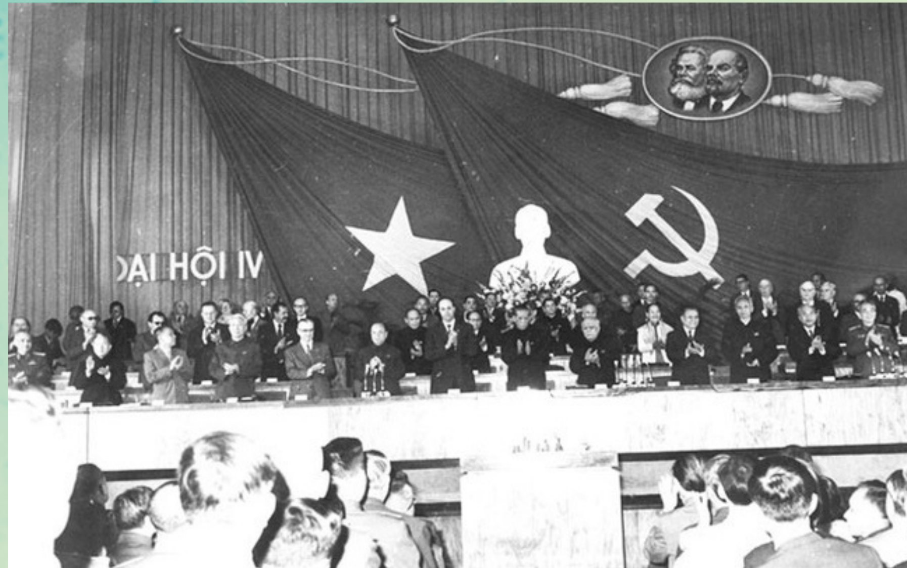
Đại hội đại biểu toàn quốc lần thứ IV của Đảng Tháng 12-1976

Đại hội Đảng toàn quốc lần thứ IV (tháng 12/1976) đánh giá: “Năm tháng sẽ trôi qua nhưng thắng lợi của nhân dân ta trong sự nghiệp chống Mỹ, cứu nước mãi mãi được ghi vào lịch sử dân tộc ta như một trong những trang chói lọi nhất, một biểu tượng sáng ngời về sự toàn thắng của chủ nghĩa anh hùng cách mạng và trí tuệ con người, và đi vào lịch sử thế giới như một chiến công vĩ đại của thế kỷ XX, một sự kiện có tầm quan trọng quốc tế to lớn và có tính thời đại sâu sắc”.